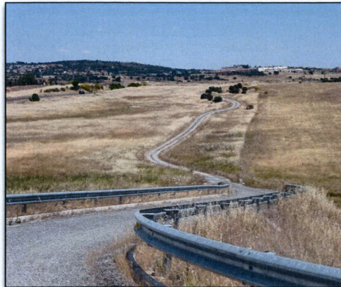
FOTO J. Cordel de Malpartida a Aliseda de Azalea desde el paso sobre el ff.cc