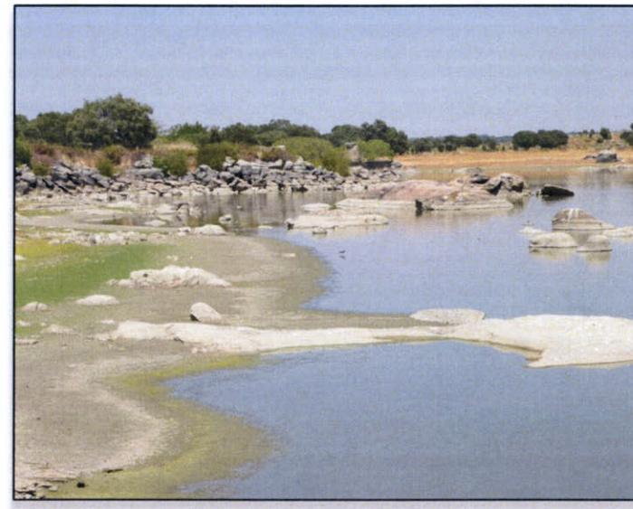
Embalse de la Charca del Lancho. Presa del s.XVIII