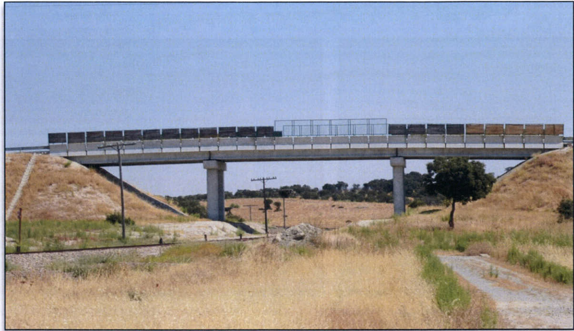
FOTO 7. Paso sobre ff.cc. de camino existente sobre el p.k. 1+400 en margen izquierda