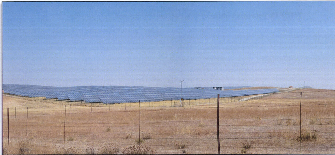
FOTO 19. Central eléctrica solar en las proximidades de la traza. P.k. 7+400 a 8+200