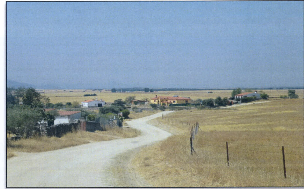
FOTO 20. Zona de viviendas tramo sobre el p.k. 8+200 (solicitud D.I.A. Ayto. Malpartida)