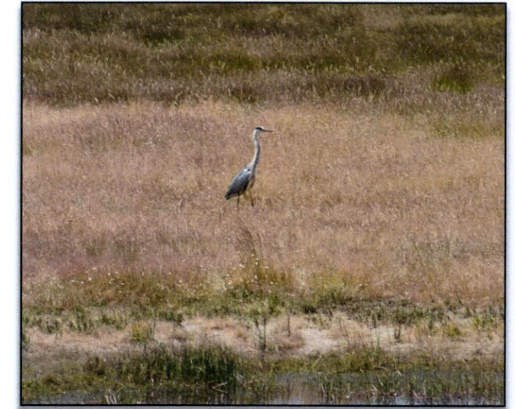
FOTO M. Ejemplar de garza en la charca de la foto anterior.