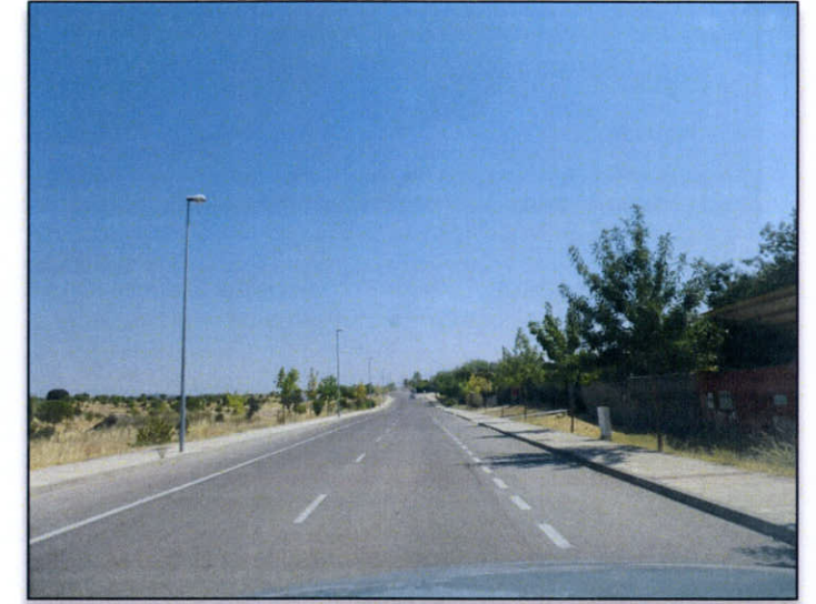
FOTO F. Zona de la Urbanización Los Arenales.