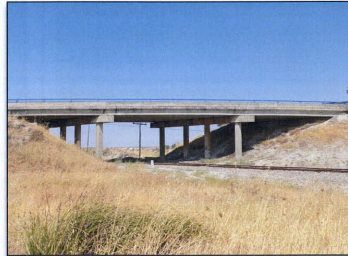
FOTO 9. Paso sobre ff.cc. actual N-521