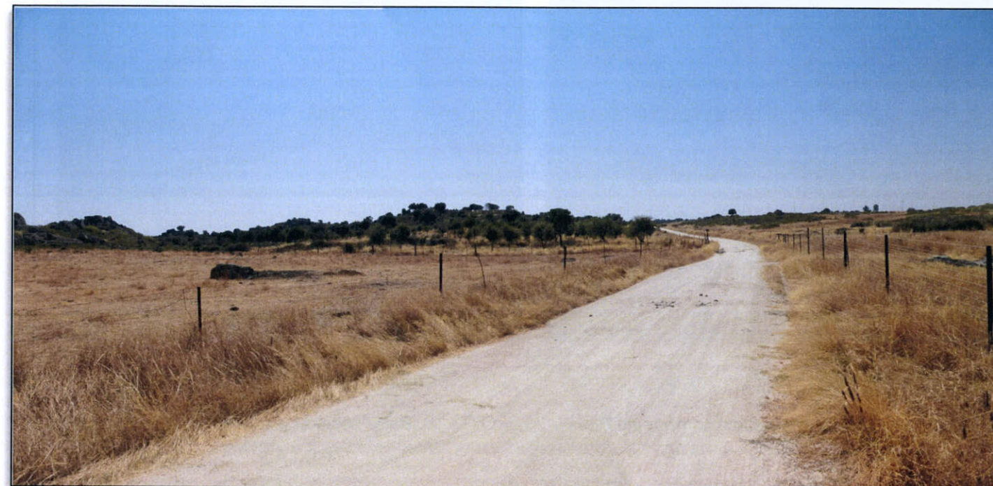
FOTO 15. Vista general del cruce de la traza con el camino sobre el p.k. 6+300