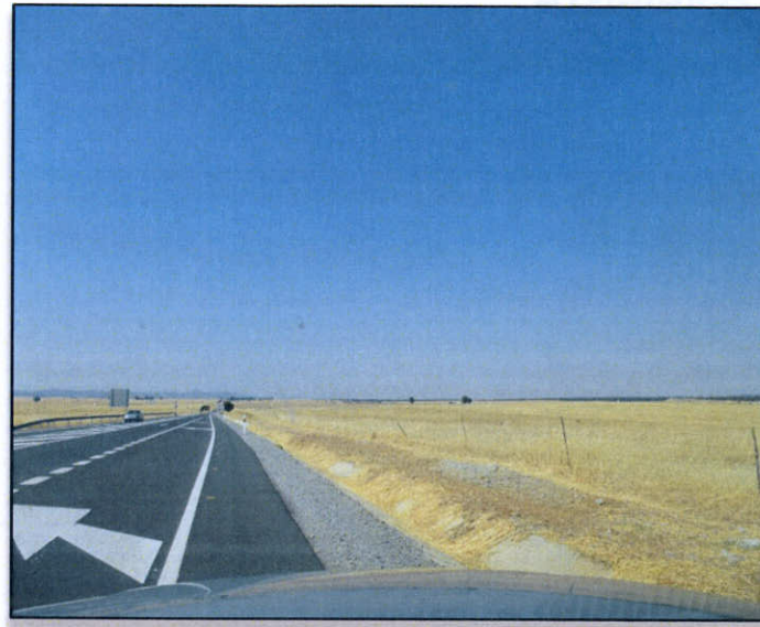
FOTO 23. Vista general de la zona final del trazado. Situación Enlace Malpartida Oeste.