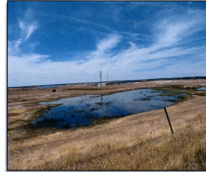
FOTO L. Charca del p.k. 7+400 al norte de la traza. Al fondo, Planta fotovoltaica