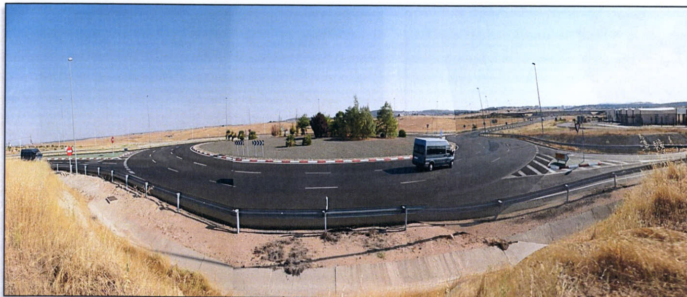
FOTO 2. Glorieta sobre la N-521 existente en el p.k. 0+300 del trazado. A la derecha, el Centro de Conservación de Carreteras.