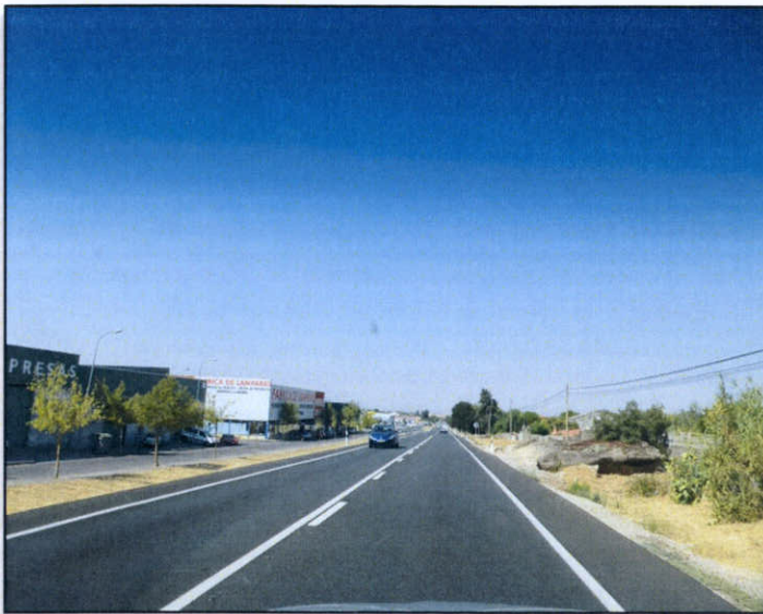
FOTO C. N-521 actual entre Malpartida y polígono industrial