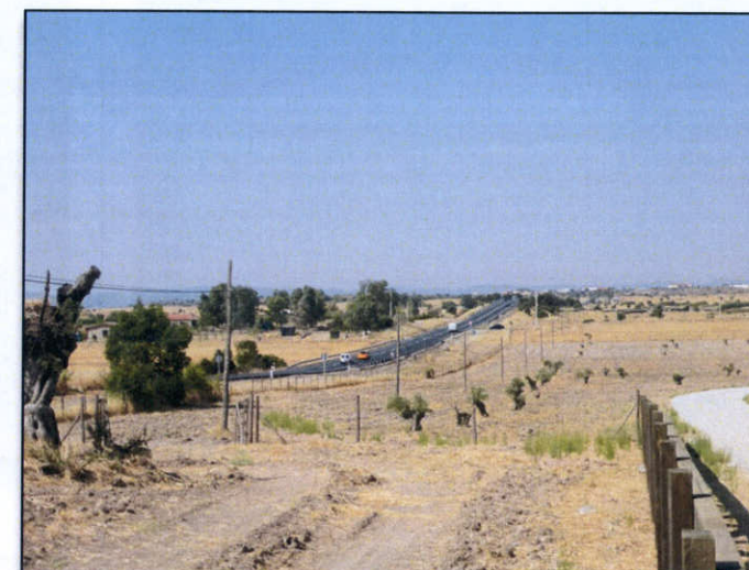
FOTO 5. Vista N-521 y zona via de servicio derecha desde el P.k. aprox. 0+800