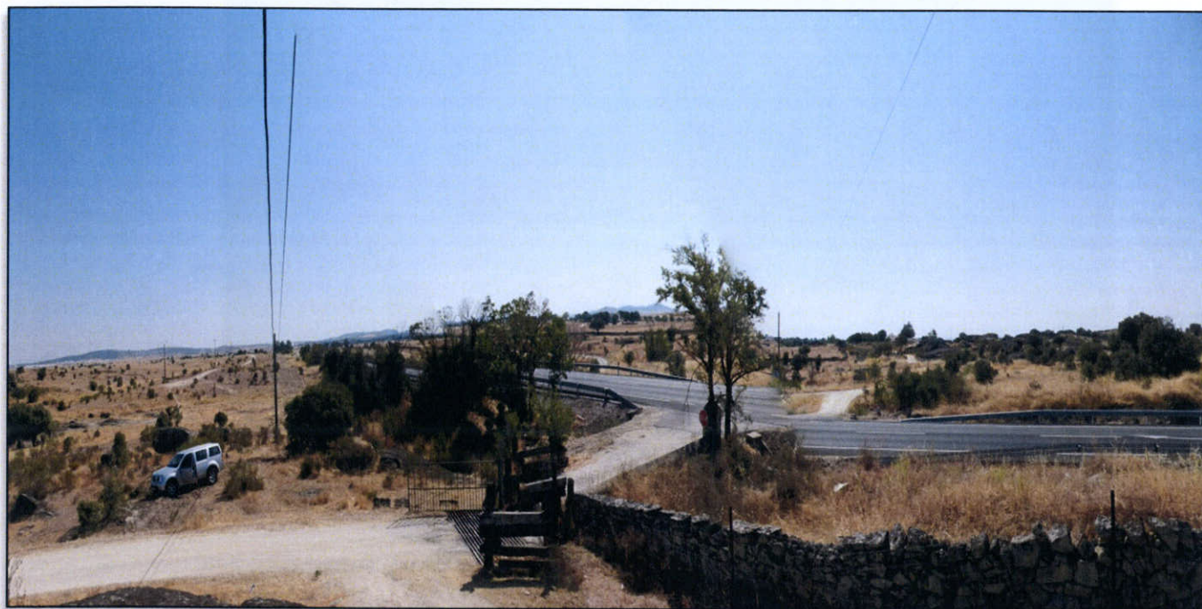
FOTO 13. Vista general zona Semienlace Malpartida Este. A la izquierda, cola de embalse de Charca Arroyo Majón