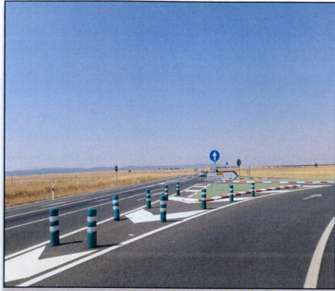
FOTO 22. Actual intersección entre la N-521 y la EX207