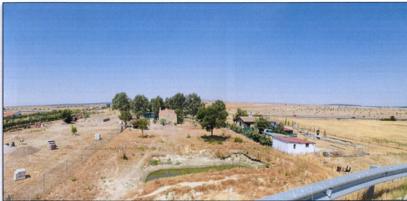
FOTO 8. Propiedades que se ven afectadas en margen izquierda. P.k. 1+200 a 1+500