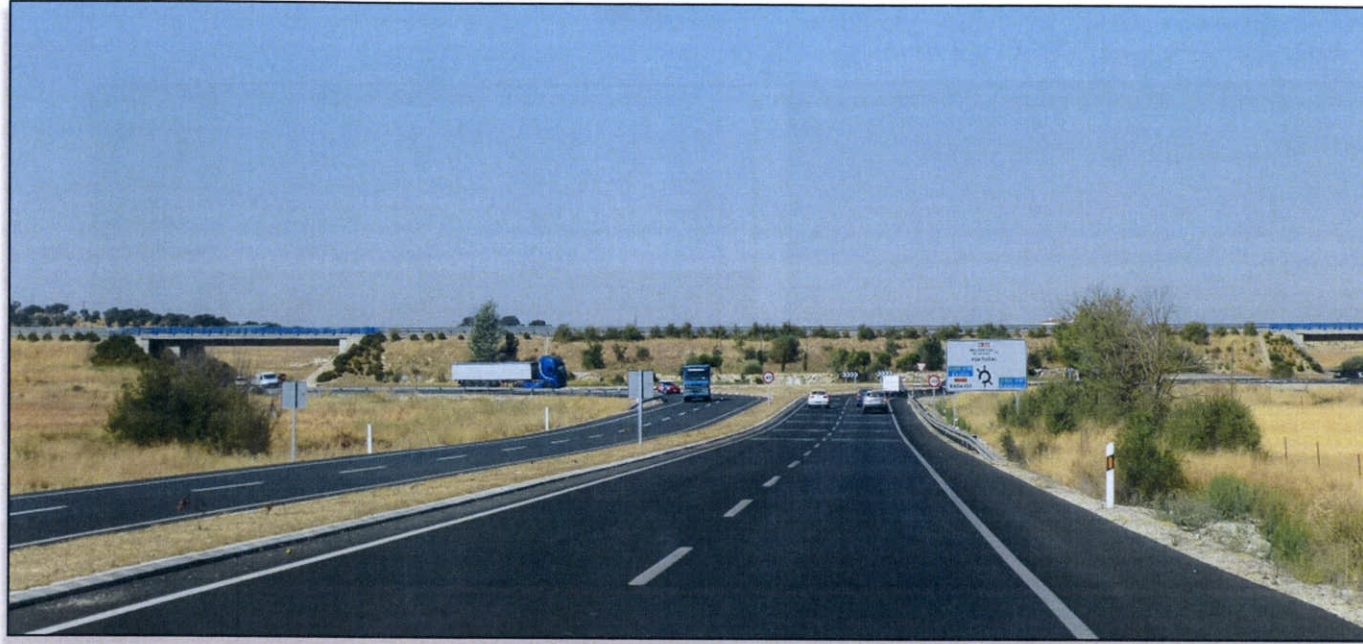
FOTO 1. Glorieta de Enlace entre la N-521 y la A-66 viniendo desde Cáceres