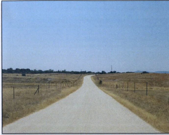
TO 17. Zona de la traza en el cruce con camino P.k. 7+300