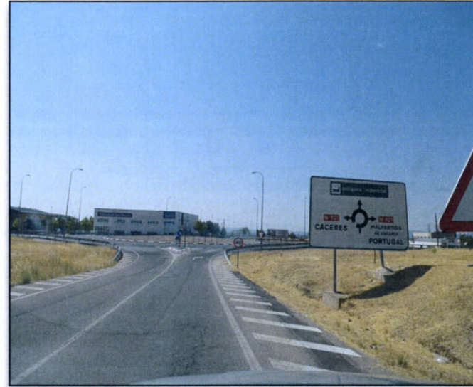
FOTO B. Glorieta en la N-521 en el tramo del polígono industrial de Malpartida