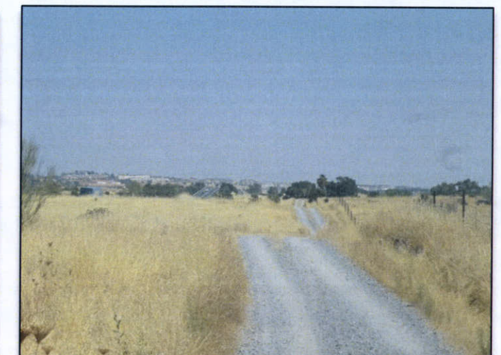
FOTO 6. Vista zona via de servicio izquierda desde el P.k. aprox. 0+900. Cordel de Malpartida a Aliseda de Azalea.