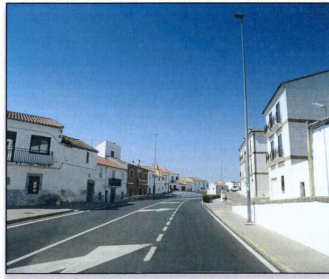
FOTO D. Actual travesía de la N-521 en Malpartida.