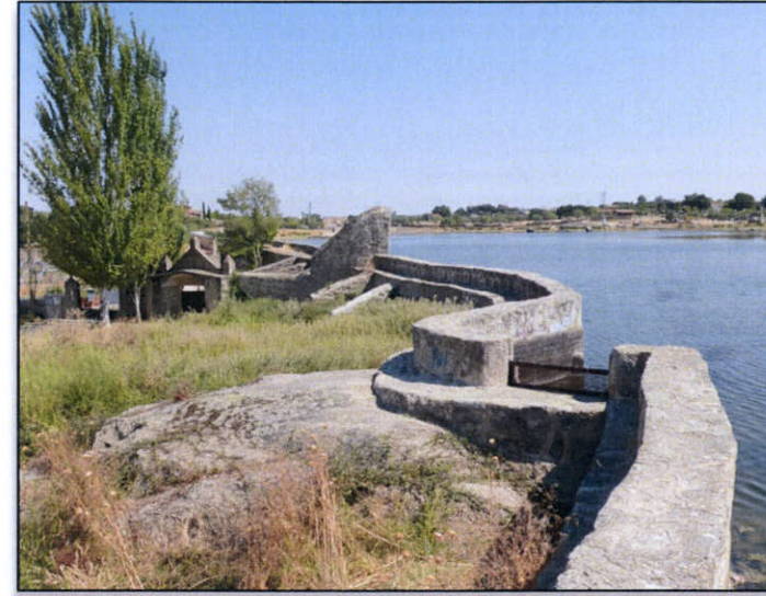
FOTO E. Charca del Lugar. Presa del s.XVIII en Malpartida