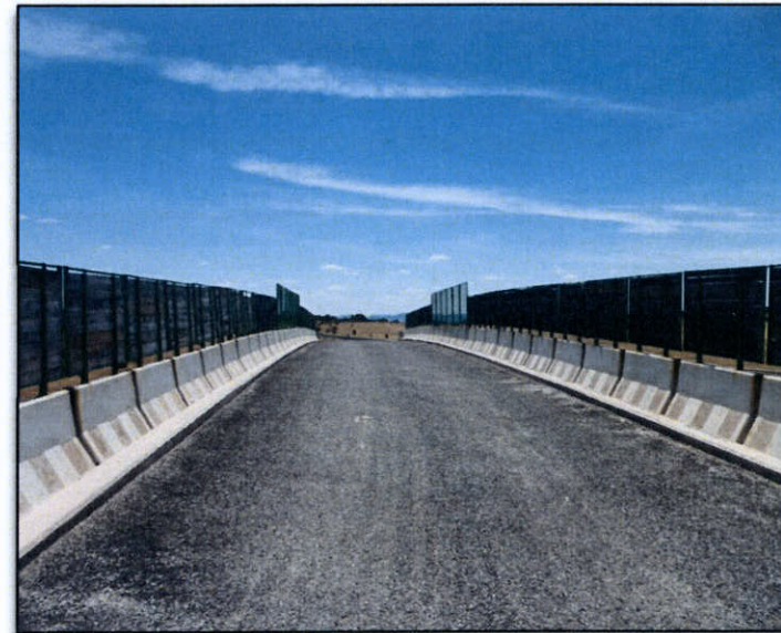
FOTO K. Paso sobre ff.cc. del Cordel de Malpartida a Aliseda de Azalea