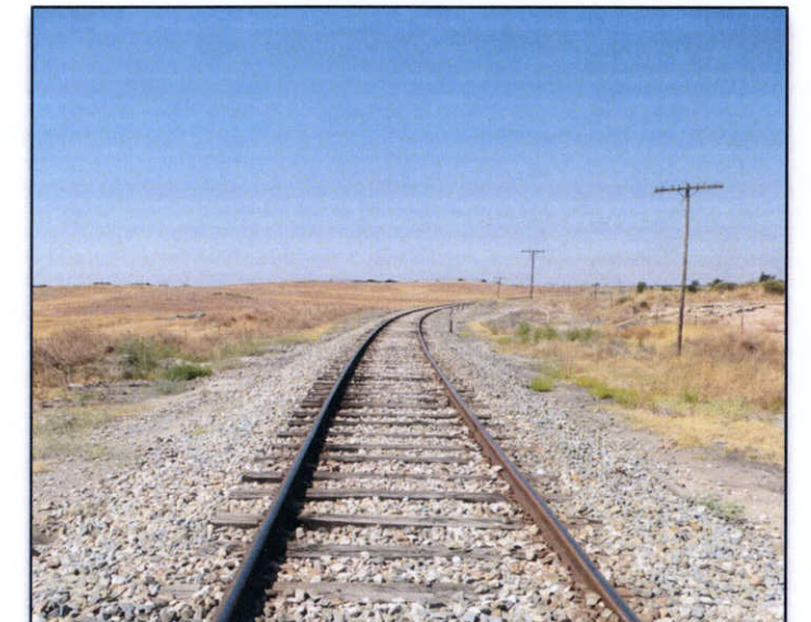
Línea de ff.cc. Cáceres-Valencia de Alcántara