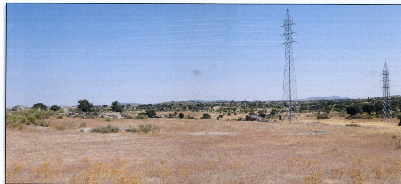
FOTO 16. Vista general de la traza sobre el p.k. 6+500-7+000. Torres de alta tensión